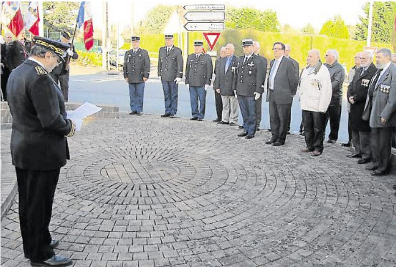
En présence du sous-préfet, des autorités civiles et militaires, des anciens combattants, un hommage a été rendu aux morts en Algérie, Maroc et Tunisie.

Mercredi soir, le comité mayennais de la fédération nationale des anciens combattants d'Algérie, Maroc, Tunisie a commémoré le 52 e anniversaire du cessez-le-feu en Algérie. Par classes entières, près de trois millions de jeunes gens du contingent furent mobilisés en Afrique du nord, de 1952 à 1962. Trente mille n'eurent pas la chance d'en revenir. Près de 300 000 furent blessés ou malades.