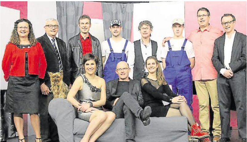
Les membres de l'Atelier de Zoé lors de leur dernière représentation de Symphonie en sol à Gorron, en février.

La troupe de théâtre amateur en Pays de Mayenne, propose deux représentations de sa dernière création : Symphonie en sol .